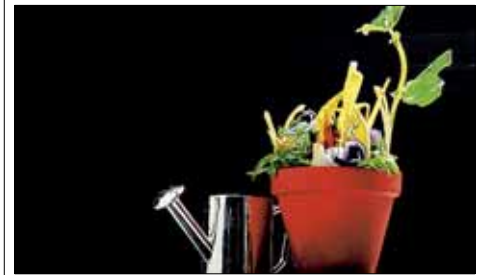
● Красиво оформленное блюдо значительно улучшает усвоение пищи.